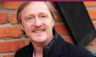
Künstlerischer Leiter: Albrecht Mayer